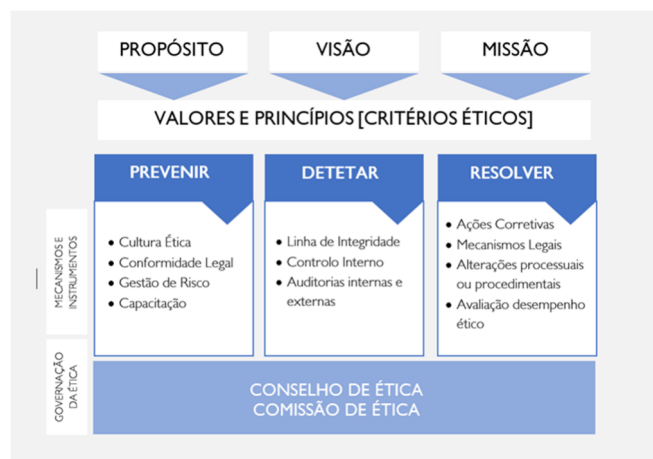
Figura I – Modelo de Integridade do Grupo AdP

Destaque-se ainda o facto de em 2021, no âmbito da implementação do modelo de integridade do Grupo AdP, ter sido aprovado, o já atrás referido, Regulamento de Denúncias Voluntárias de Irregularidades do Grupo AdP.